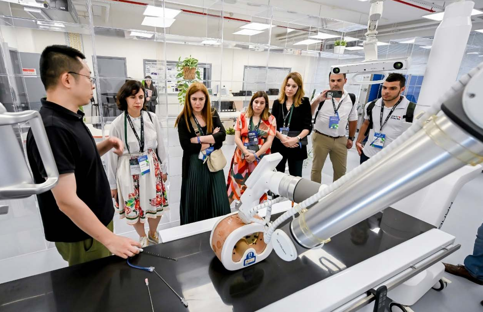
葡语国家科创企业代表于2024年实地考察澳门、横琴、珠海和广州 Representantes de empresas tecnológicas dos Países de Língua Portuguesa efectuaram, em 2024, uma visita a Macau, Hengqin, Zhuhai e Guangzhou

此外，中葡论坛的其他与会国亦将最新的《经贸合作行动纲领》视作一项为数字经济、物流和数字化等各领域“提供促进投资机遇”的协议。