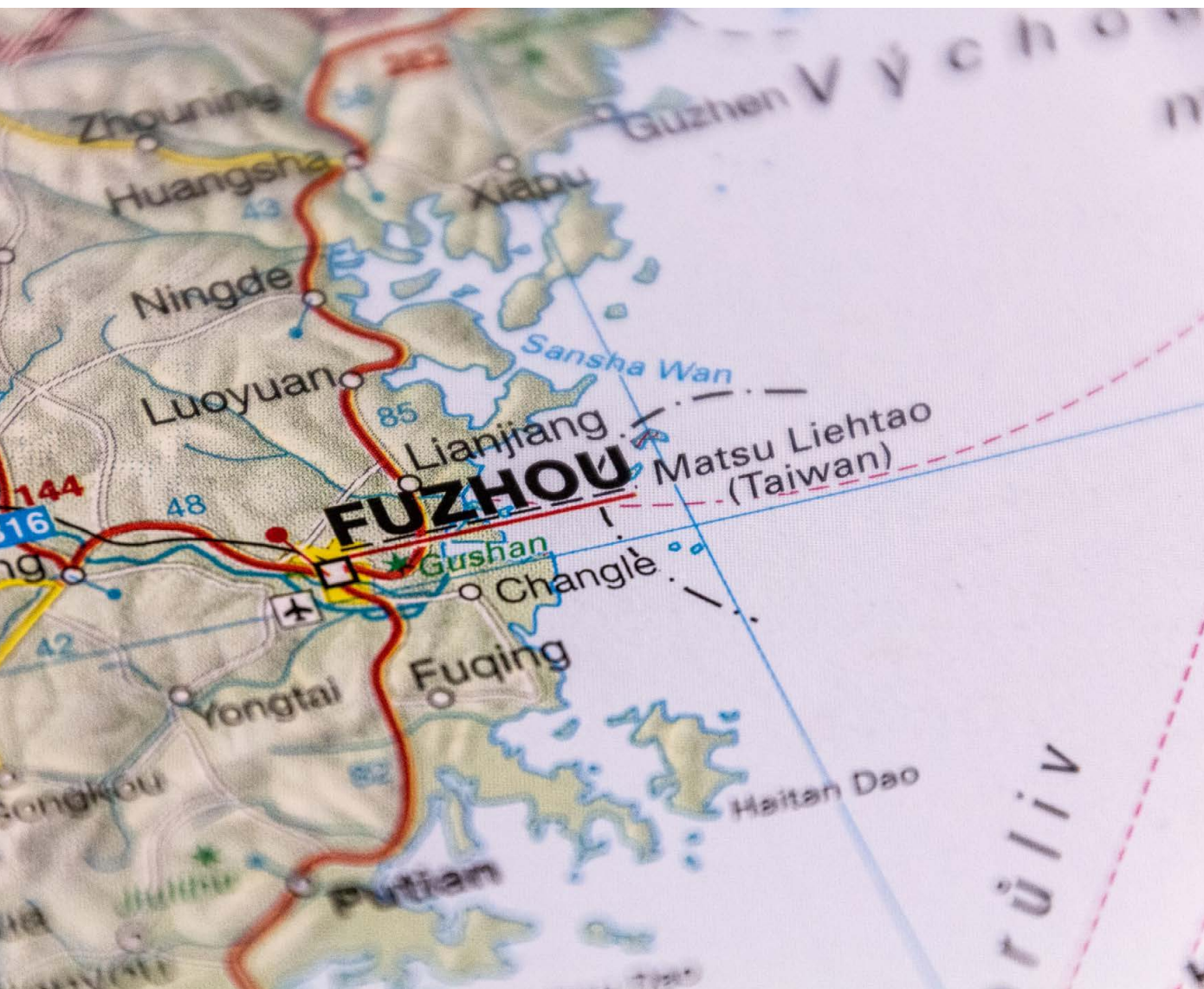
福州市当局深化与葡语国家在渔业领域的合作

As autoridades de Fuzhou têm aprofundado a cooperação no domínio da pesca com os Países de Língua Portuguesa