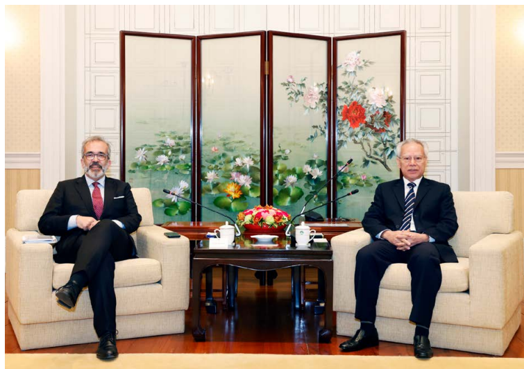
保罗·兰热尔亦到访澳门，并与澳门特区行政长官岑浩辉会面 Paulo Rangel também visitou Macau, onde se reuniu com o Chefe do Executivo local, Sam Hou Fai

Antes de regressar a Lisboa, Paulo Rangel esteve em Macau, onde se encontrou com o Chefe do Executivo do território, Sam Hou Fai. As duas partes trocaram opiniões sobre o intercâmbio e a cooperação bilateral nas áreas judicial, económico-comercial e da educação, entre outras. Sam Hou Fai sublinhou que Macau tem aprofundado o seu papel de ponte e plataforma entre a China e os países lusófonos, impulsionando, de forma contínua, o estabelecimento de relações amistosas nas diversas áreas de cooperação. O Chefe do Executivo da RAEM disse ainda esperar visitar Portugal num futuro próximo. ■