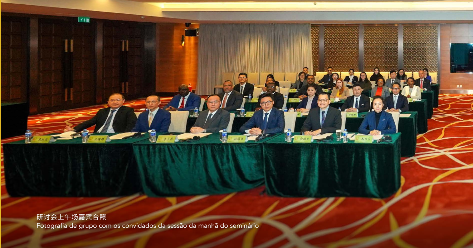
研讨会上午场嘉宾合照

Fotografia de grupo com os convidados da sessão da manhã do seminário