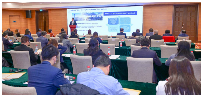
中国与葡语国家金融专题研讨会吸引约80人参加 O “Seminário Temático Financeiro entre a China e os Países de Língua Portuguesa” atraiu cerca de 80 participantes

澳门金融管理局与中葡合作发展基金自2019年起，面向本地金融业界共举办了六期专题培训交流活动，主题涵盖债券市场、财富管理、金融科技、融资租赁和葡语国家投资合作等，累计超过300人次参与。 ■