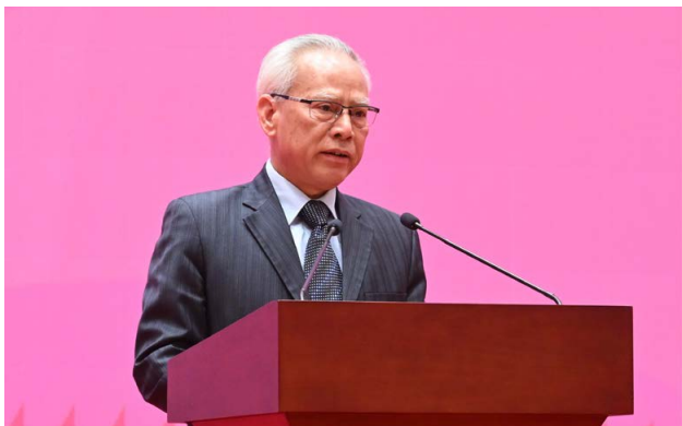
行政长官岑浩辉出席中葡论坛常设秘书处2025年新春招待会 Chefe do Executivo, Sam Hou Fai, na Recepção da Festa da Primavera de 2025 do Secretariado Permanente do Fórum de Macau