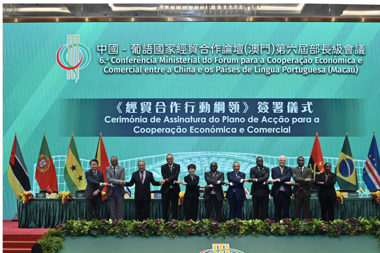
第六届部长级会议上签署的最新《行动纲领》将科技领域定为优先事项之一 O mais recente Plano de Acção, assinado durante a 6.ª Conferência Ministerial, estabelece a área da tecnologia como uma das prioridades

O documento refere que os Ministros “acordaram em apoiar o reforço da cooperação entre os