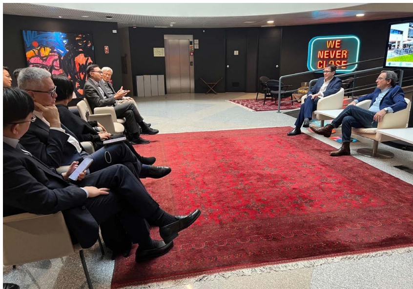
香港代表团考察葡萄牙最大的科技园区 Taguspark Visita da delegação de Hong Kong ao Taguspark, o maior parque empresarial de ciência e tecnologia de Portugal