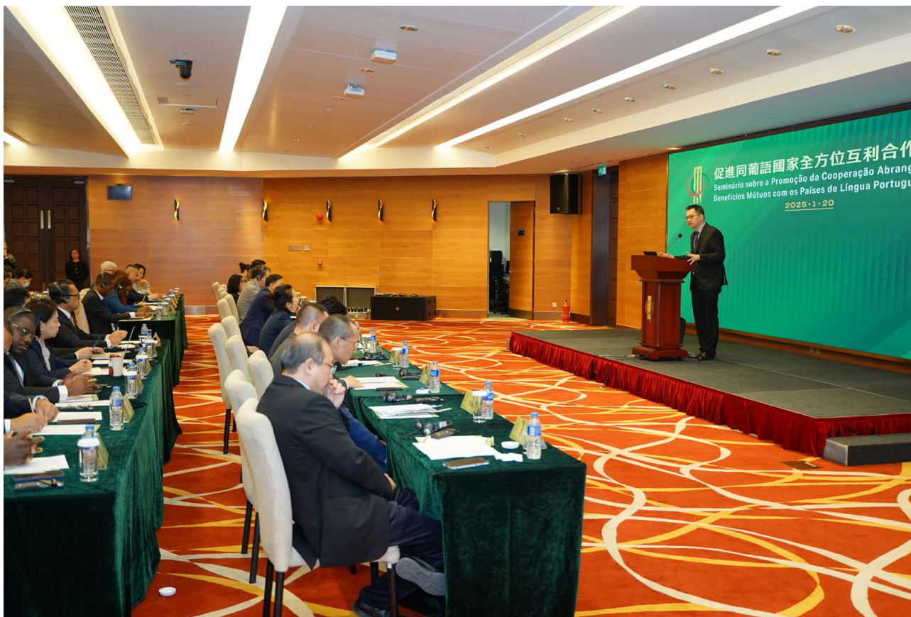
澳门特别行政区招商投资促进局主席余雨生 Presidente do Instituto de Promoção do Comércio e do Investimento, Vincent U U Sang

relacionadas com a cooperação sino-lusófona. “No que diz respeito à internacionalização das empresas chinesas, é necessário fornecer maior apoio político, enquanto que, na atracção de investimentos, é importante pesquisar e oferecer políticas mais favoráveis e condições facilitadoras”, afirmou.