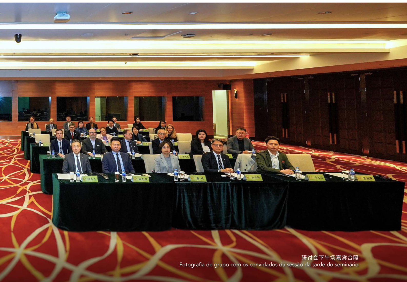
研讨会下午场嘉宾合照