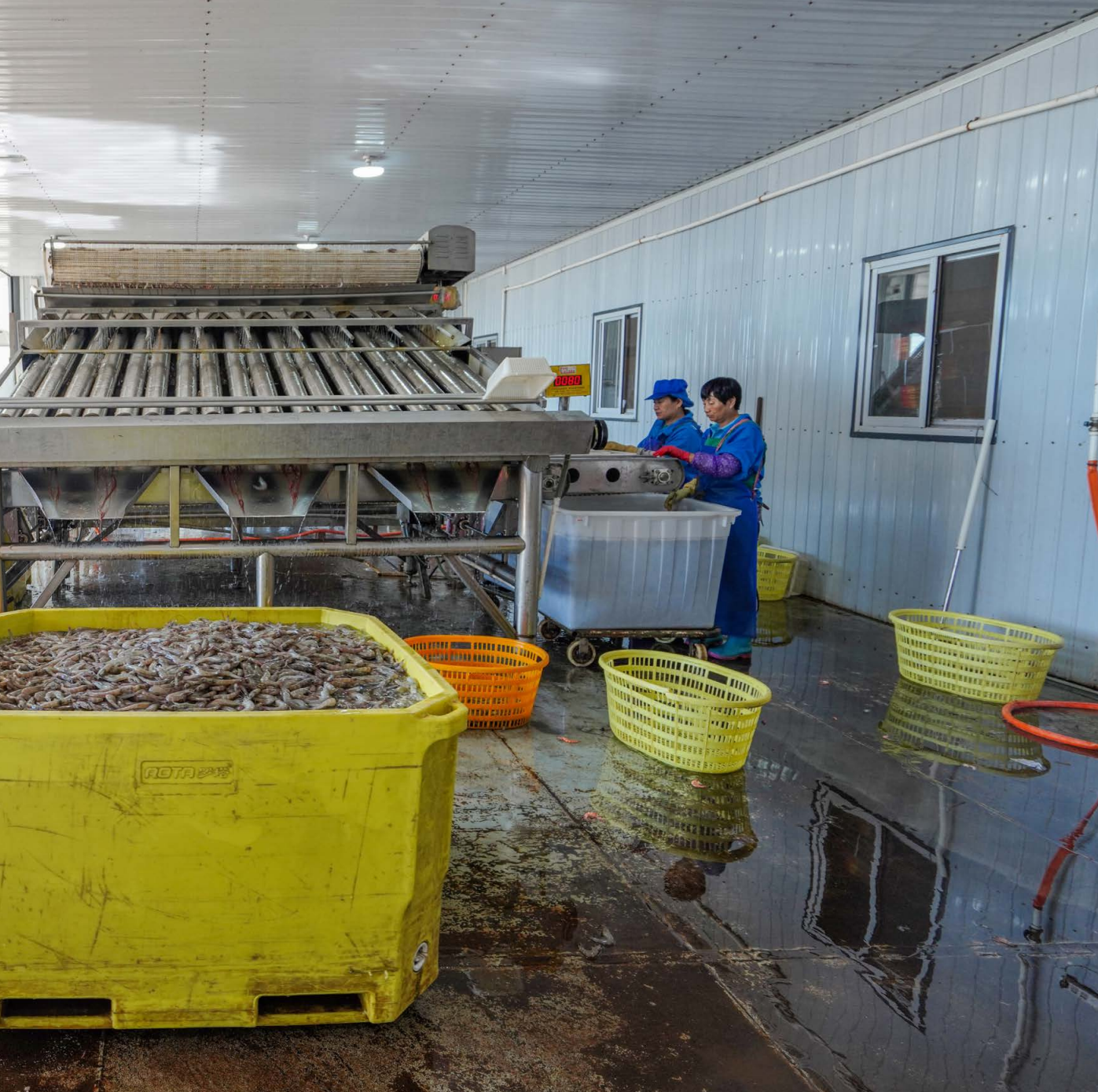
福建省被视为“二十一世纪海上丝绸之路”的组成部分 A Província de Fujian é definida como parte da “Rota Marítima da Seda para o Século XXI”

marítima, na prática do conceito de “abordagem de grande alimentação” e na integração do desenvolvimento de “três mares” - entre estreitos, rota de seda marítima e oceano -, ao longo das últimas três décadas. Foi também dado início à elaboração do primeiro mapa da economia marítima de Fuzhou.