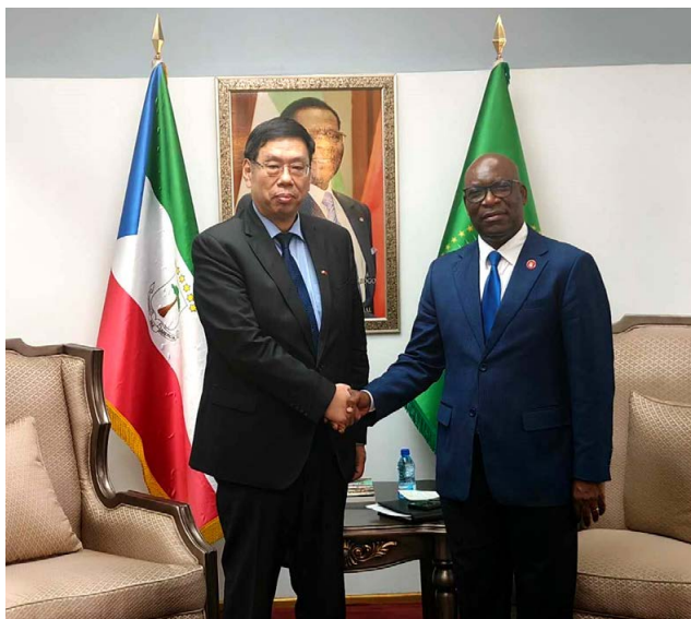
中国驻赤道几内亚大使王文刚（左）以及赤道几内亚外交、国际合作与侨务部部长奥约诺（右） O Embaixador da China na Guiné Equatorial, Wang Wengang (esq.), e o Ministro de Estado dos Assuntos Exteriores, Cooperação Internacional e Diáspora do país africano, Simeón Oyono Esono Angue (dir.)

Também em Março, Wang Wengang manteve um encontro com a primeira-dama da Guiné Equatorial, Constança Mangué de Obiang. A reunião serviu para trocar pontos de vista relacionados com a cooperação em áreas como a saúde, a educação e os assuntos das mulheres e crianças. ■