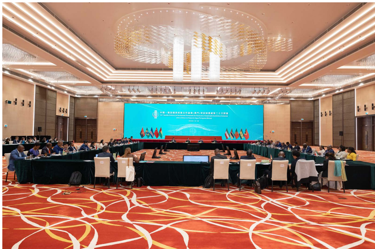
各与会国代表出席会议

A reunião contou com representantes de todos os países participantes