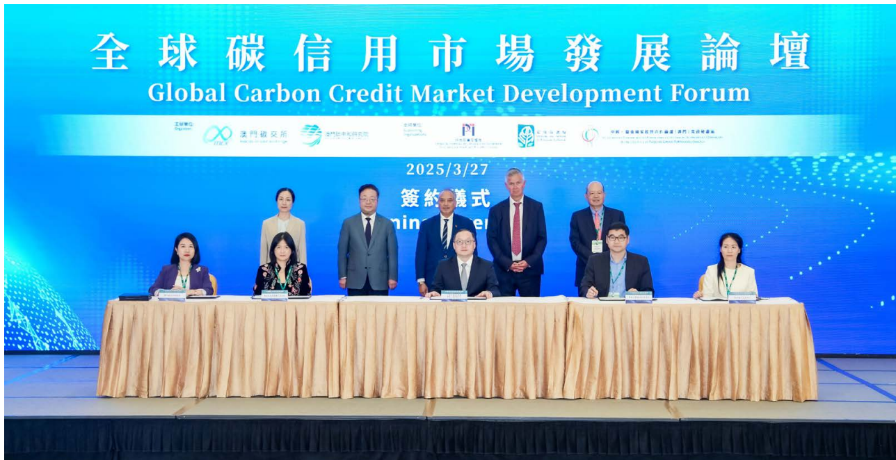
副秘书长谢颖见证签约仪式 A Secretária-Geral Adjunta Xie Ying testemunhou a cerimónia de assinatura de acordos durante o evento