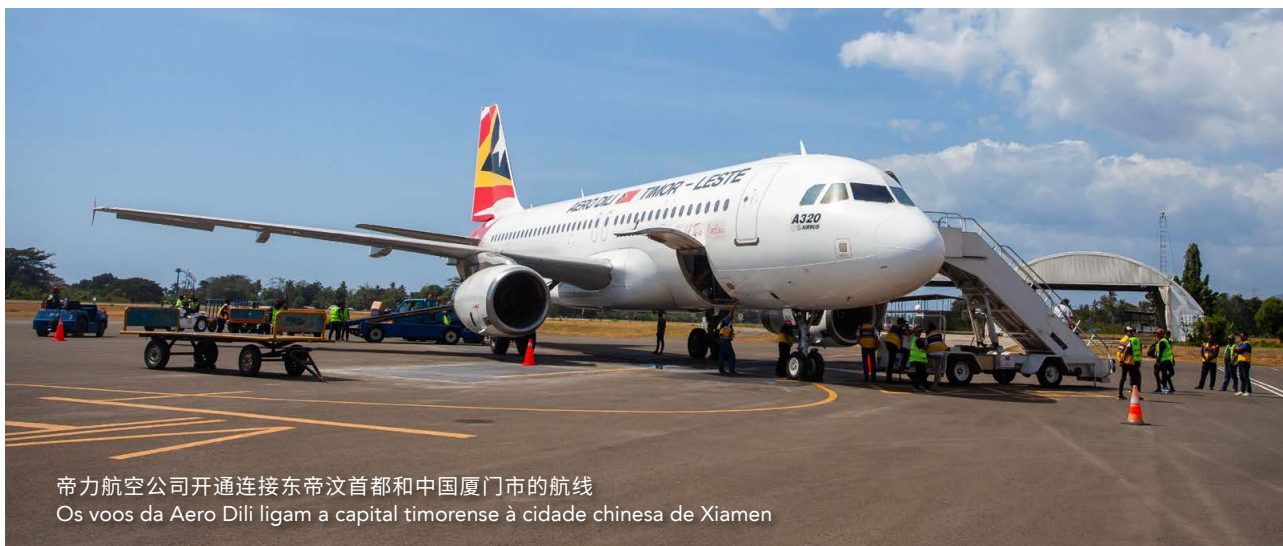
帝力航空公司开通连接东帝汶首都和中国厦门市的航线 Os voos da Aero Dili ligam a capital timorense à cidade chinesa de Xiamen

A capital de Timor-Leste, Díli, está agora a pouco mais de cinco horas da China, depois do lançamento do primeiro serviço de voo comercial entre os dois países. A rota liga a cidade timorense a Xiamen, na província de Fujian, no sudeste da China.