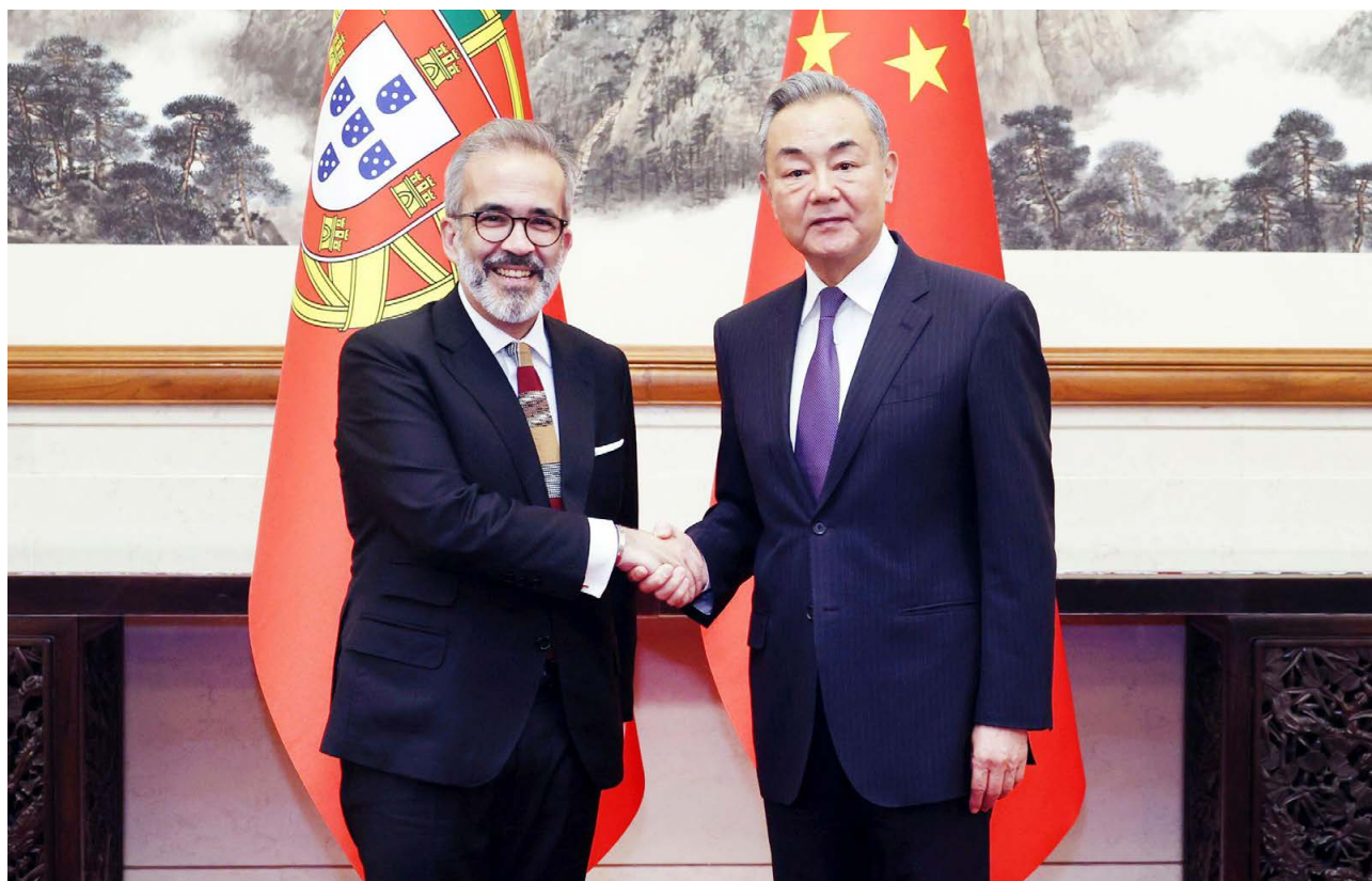
葡萄牙国务部兼外交部长保罗·兰热尔（左）与中国外交部长王毅（右） O Ministro de Estado e dos Negócios Estrangeiros português, Paulo Rangel (esq.), e o seu homólogo chinês, Wang Yi (dir.)

Durante a reunião, o governante chinês recordou que se assinalam, em 2025, o 20.º aniversário da parceria estratégica global entre a China e Portugal e o 50.º aniversário do estabelecimento de relações diplomáticas entre a China e a União Europeia (UE). De acordo com um comunicado do Ministério dos Negócios Estrangeiros chinês, Wang Yi expressou a disposição da China em trabalhar com Portugal rumo a uma relação bilateral cada vez mais estável, frutífera e dinâmica.