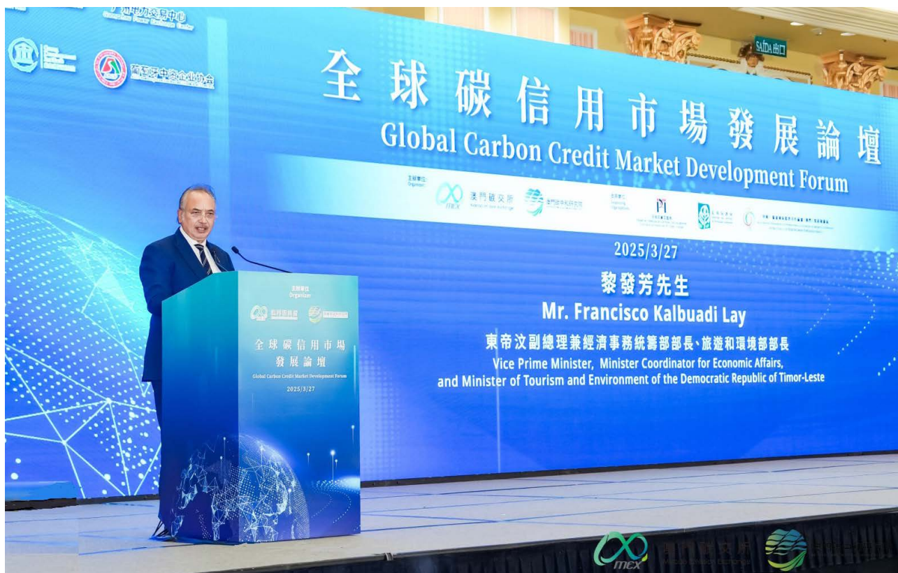
东帝汶副总理黎发芳致辞 Discurso do Vice-Primeiro-Ministro de Timor-Leste, Francisco Kalbuadi Lay