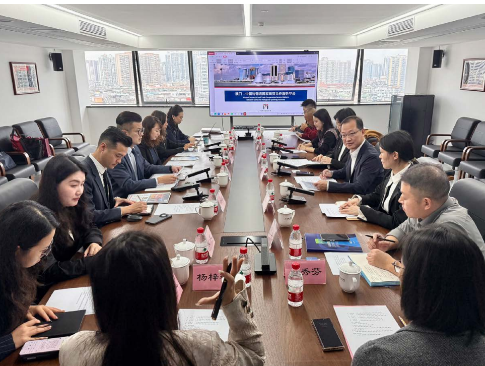
澳门代表团到访广州市商务局 Visita da delegação de Macau aos Serviços do Comércio do Município de Guangzhou

Uma delegação do Instituto de Promoção do Comércio e do Investimento (IPIM) da Região Administrativa Especial de Macau (RAEM) e da Associação de Bancos de Macau deslocou-se à província chinesa de Guangdong, em Março, para a realização de actividades promocionais de captação de negócios. O principal objectivo da visita de dois dias foi incentivar empresas da Grande Baía Guangdong-Hong Kong-Macau a estabelecerem ligações com os mercados dos Países de Língua Portuguesa através de Macau.