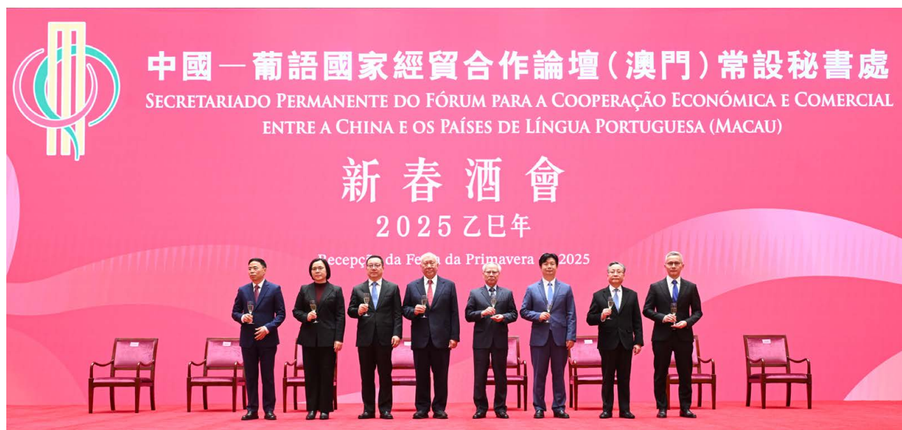
嘉宾在2025年新春招待会合影 Foto dos convidados na Recepção da Festa da Primavera de 2025

葡语国家驻华外交机构代表、澳门特区政府部门、工商协会、大专院校、葡语国家社团、在澳中资企业、中葡论坛常设秘书处全体成员等近300人出席了招待会。 ■