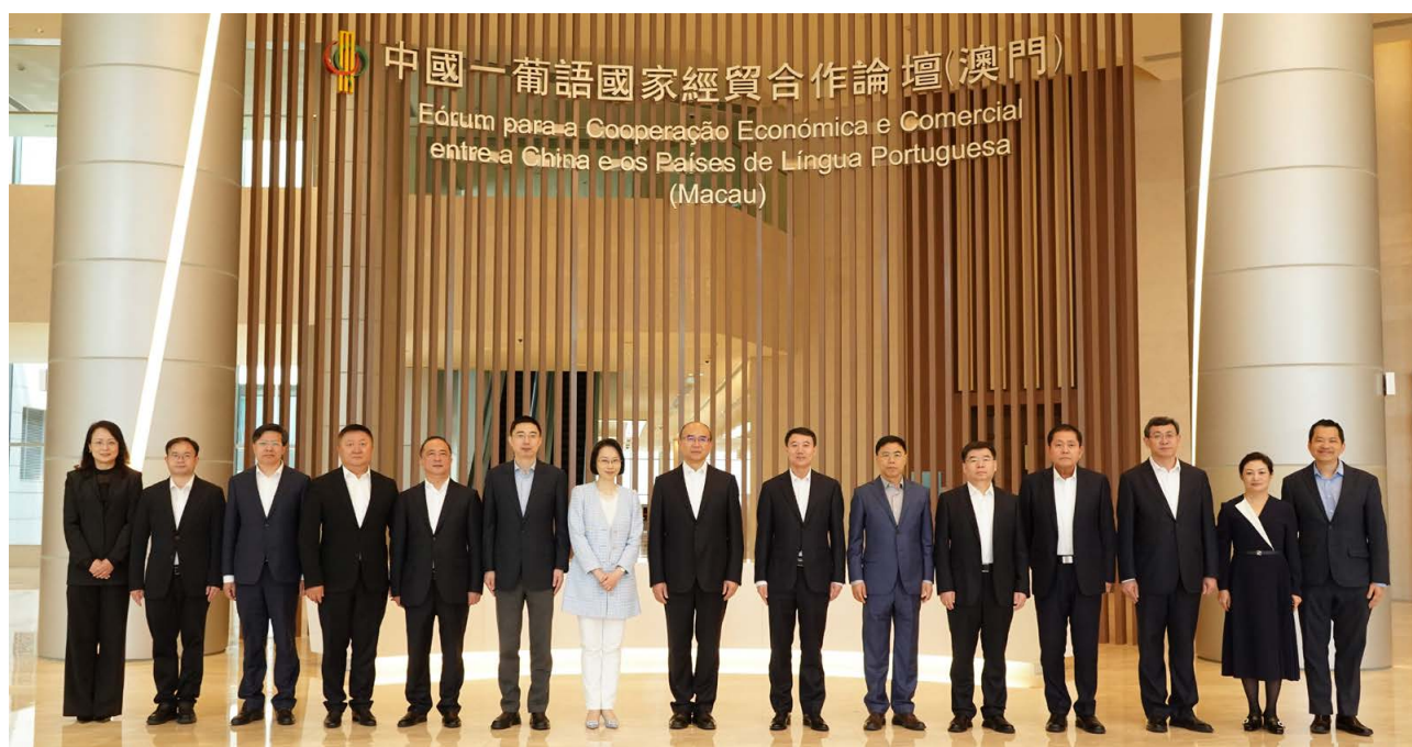
黑龙江省代表团合影 Fotografia de grupo com a delegação da Província de Heilongjiang

O Secretariado Permanente do Fórum de Macau e o Departamento do Comércio da Província de Heilongjiang assinaram, no dia 23 de Março, um Acordo-Quadro de Cooperação, visando aprofundar o intercâmbio bilateral.