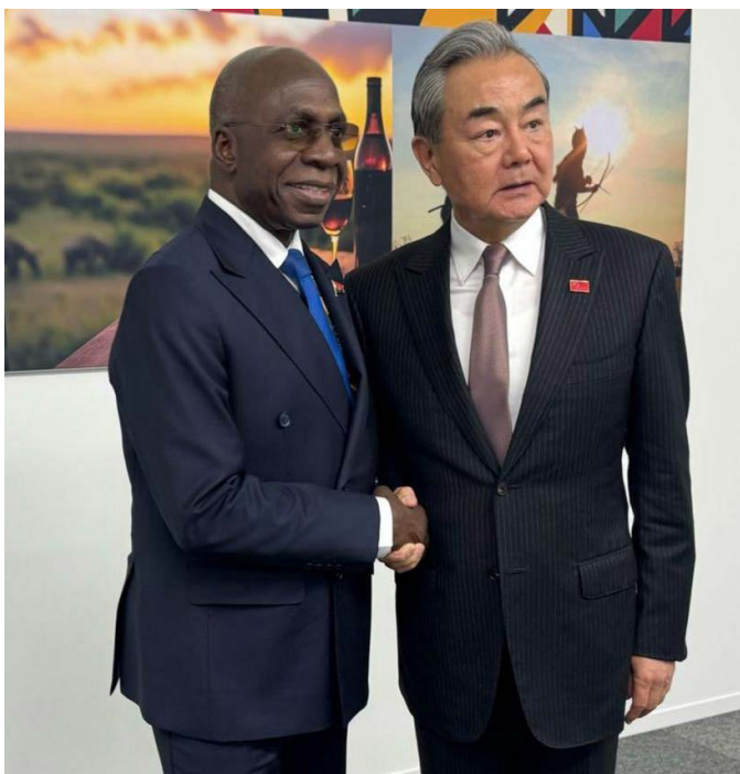
安哥拉外长泰特·安东尼奥（左）以及中国外交部长王毅（右） O Ministro das Relações Exteriores de Angola, Tété António (esq.), e o seu homólogo chinês, Wang Yi (dir.)

中华人民共和国外交部长王毅于2月在南非约翰内斯堡参加二十国集团（G20）外长会议期间与安哥拉外长泰特·安东尼奥会面，共同讨论双边关系。