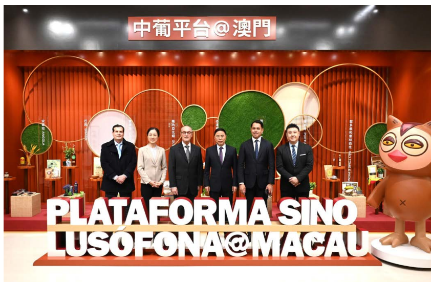
魏子明在常设秘书处成员的陪同下参观中国与葡语国家商贸合作服务平台展示馆 Wladimir Valler Filho, acompanhado de membros do Secretariado permanente, visitou o Pavilhão de Exposição da Plataforma de Serviços para a cooperação entre a China e os Países de Língua Portuguesa

O novo Cônsul-Geral do Brasil em Hong Kong, Embaixador Wladimir Valler Filho, efectuou uma visita, no dia 23 de Janeiro, ao Secretariado Permanente do Fórum de Macau.