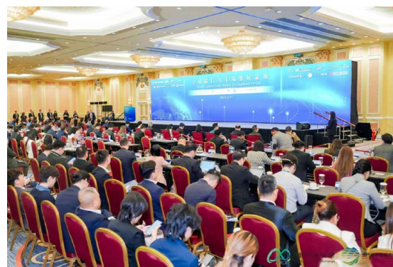
常设秘书处代表参加全球碳信用市场发展论坛 Representantes do Secretariado Permanente participaram no Fórum de Desenvolvimento do Mercado Global de Créditos de Carbono

Anualmente, o Secretariado Permanente organiza a participação dos governos e empresas dos países participantes do Fórum de Macau em conferências e exposições no domínio da protecção do meio ambiente.