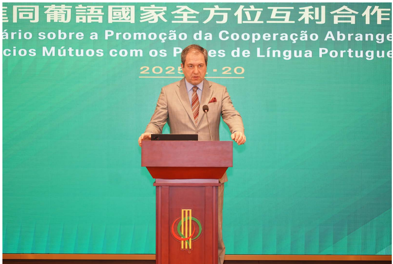
葡萄牙驻澳门总领事雷德生 Cônsul-Geral de Portugal em Macau, Alexandre Leitão

Países de Língua Portuguesa. “Assim, todos os anos, admitimos 40 mestrandos e 20 doutorandos nesta área, tanto a nível nacional como internacional”, referiu o académico.